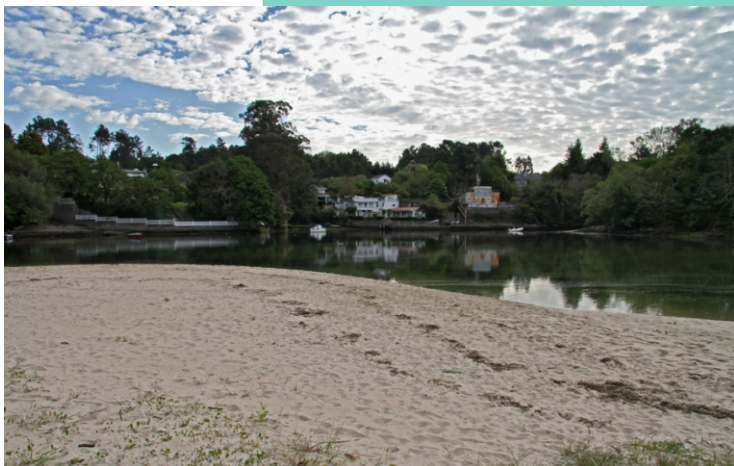
Praia Grande de Miño. Enseada de Bañobre.