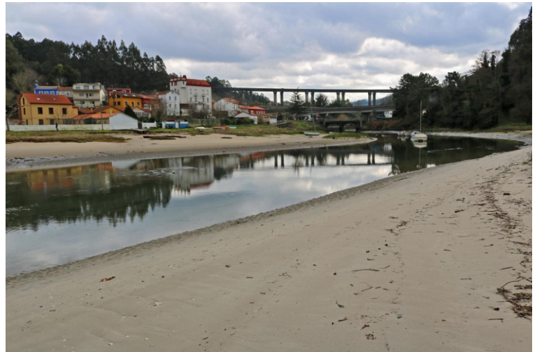
Praia da Ponte do Porco.

No concello de Miño protexe o tramo entre a desembocadura do Lambre e a praia da Ribeira, unha área de cantís co fondo areoso na que quedan ao descuberto amplos areas ao debalar a marea.