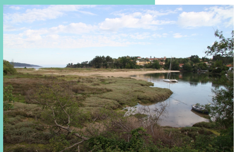
Esteiro do río Baxoi. Os ríos Anduriña e Vilariño que nacen en Monfero, na serra do Queixeiro, forman o Xurxo, en Vilarmaior, nomeado Baxoi en Miño, onde desemboca orixinando, en acción conxunta co mar, unha flecha de area que forma a praia Grande de Miño.