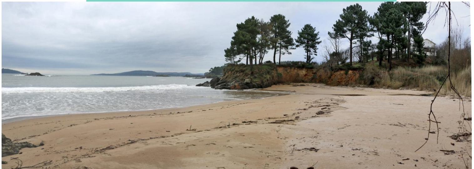
Praia de Marín