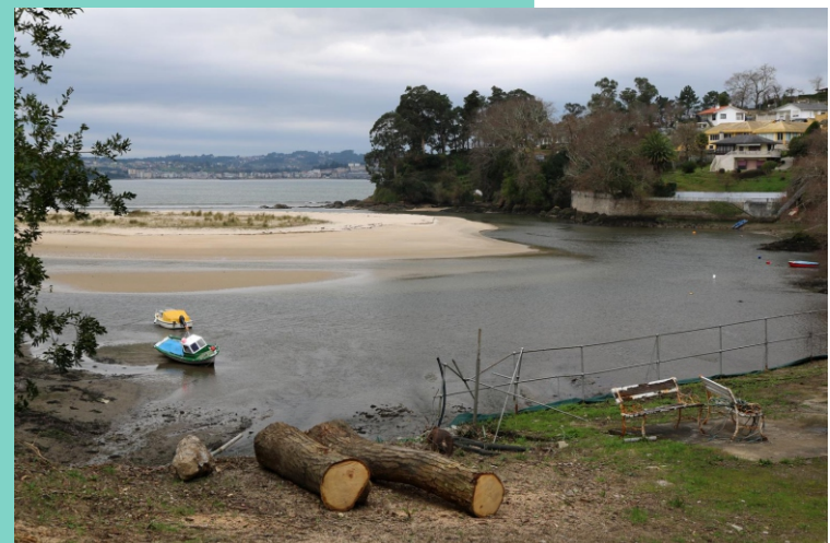
Río Xarío e flecha de Miño