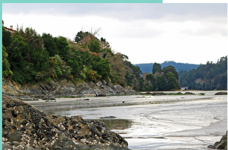
Punta Sumiño e cantís entre a punta de Gafo e punta Sumiño