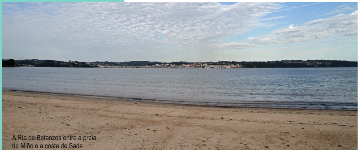
A Ría de Betanzos entre a praia de Miño e a costa de Sada

RÍA DE BETANZOS Mide 12 km de fondo e presenta dous sectores ben diferenciados. O primeiro, de Betanzos ata a ponte do Pedrido, é un esteiro típico onde sedimentan os materiais transportados polo río Mandeo. O segundo, entre as puntas Lavadoira e Torella, é máis amplo e conflúe coa ría de Ares. As rochas dominantes son xistos, filitas e lousas. É unha importante zona marisqueira.