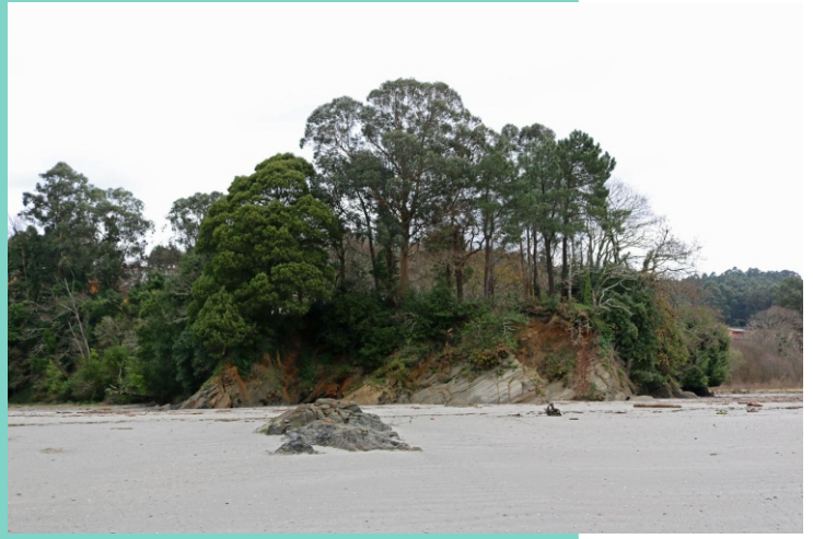
Punta do Gafo