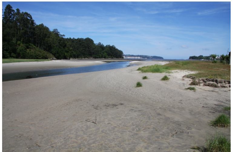
Praia da Alameda. Ponte do Porco.