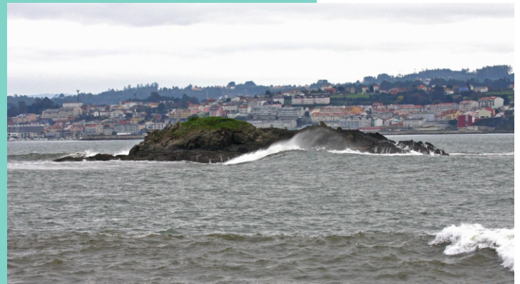
Illa do Carbón