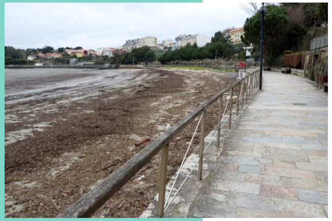
Praia Pequena de Miño, de Sumiño ou da Ribeira. No inverno as praias próximas ás desembocaduras dos ríos quedan cubertas polos materiais arrastrados polas correntes, maiormente follas secas e restos de madeira.