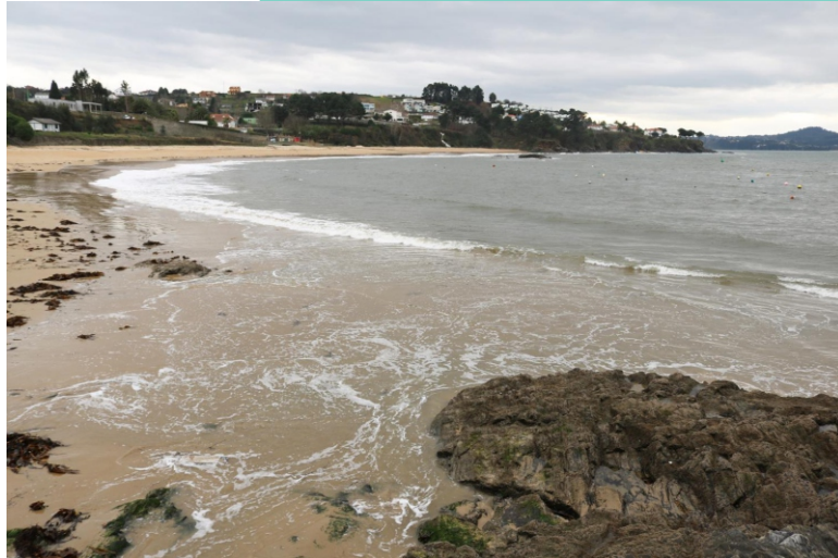
Praia de San Pedro (Perbes)