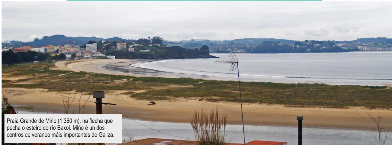
Praia Grande de Miño (1.360 m), na flecha que pecha o esteiro do río Baxoi. Miño é un dos centros de veraneo máis importantes de Galiza.