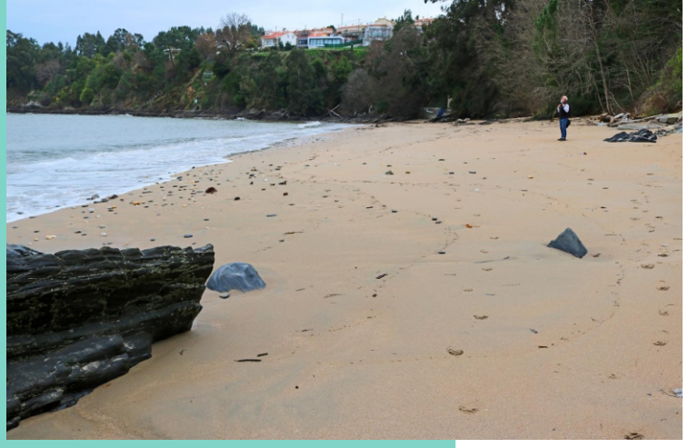
Praia do Lago